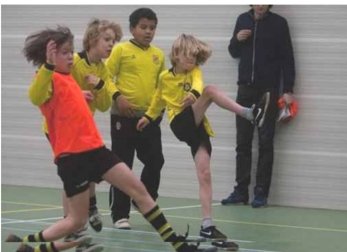
En deze mag in een instructieboekje!