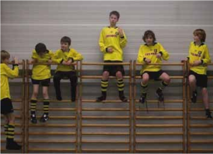
Streng verboden, maar daarom zitten ze er ook.