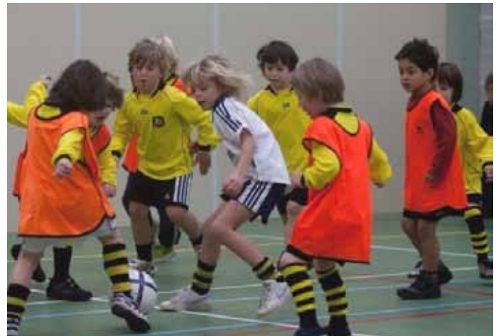
Het neusje van de zalm. Onze T-league spelers, bloedjefanatiek, op en soms over de grens, iets later op de ochtend. Zoals het eigenlijk hoort werd hier voor de eer, en niet voor een prijs gestreden. Wat een spelvreugde...