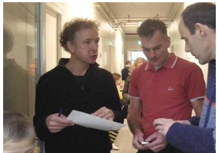
Spanning bij de organisatie. Wisselen van spelers was tot kunst verheven: de 60 wedstrijdje werden door 120 verschillende teams afgewerkt.