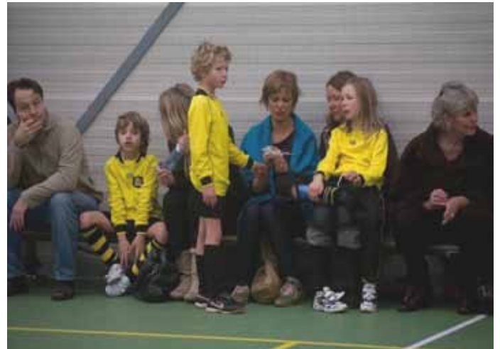
Publiek en masse aanwezig.