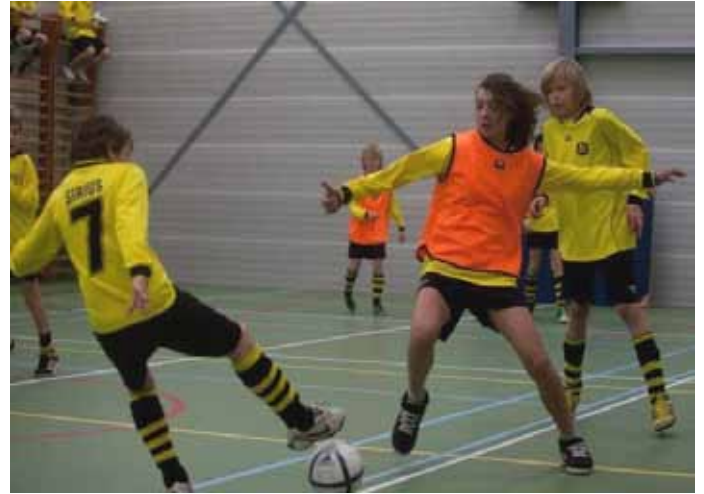
Voetbalhoogstandjes waren eerder regel dan uitzondering. Gehoord van een ouder: “waar hebben ze dat nou geleerd?”.